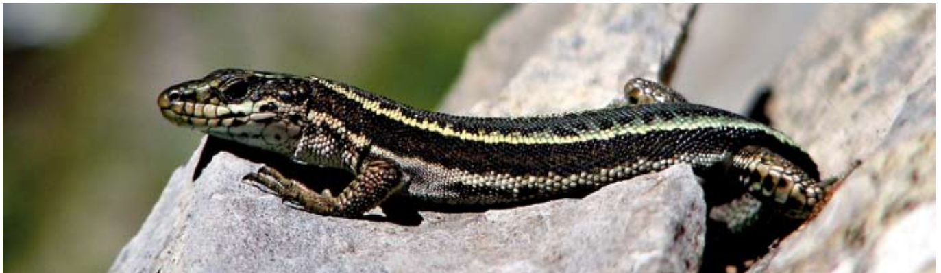
■ Le Lézard du Val d'Aran ( Iberolacerta aranica ), une espèce classée "En danger"

Répartition des 37 espèces de reptiles et des 34 espèces d'amphibiens évaluées en fonction des différentes catégories de la Liste rouge (nombre d'espèces entre parenthèses)