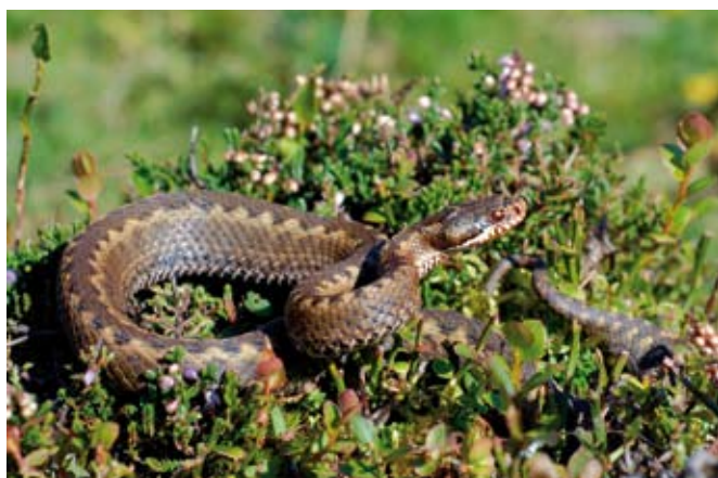
■ La Vipère de Séoane ( Vipera seoanei ), une espèce "Quasi menacée"

L'assèchement des zones humides et le comblement des mares représentent une menace pour la survie de la Grenouille des champs (En danger critique) et du Pélobate brun (En danger). La pollution des milieux aquatiques a également contribué à la raréfaction des espèces dépendantes de ces habitats naturels.