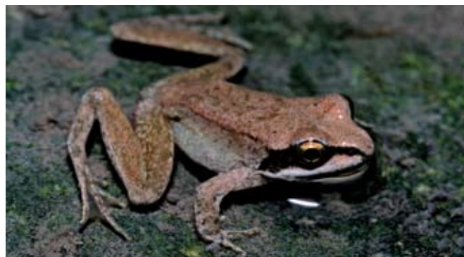
■ La Grenouille des Pyrénées ( Rana pyrenaica ), classée "En danger"

L'évolution des milieux due au déclin du pastoralisme a entraîné une forte régression de l'habitat de la Vipère d'Orsini (En danger critique), également menacée localement par des aménagements divers (routes, pistes de ski...). Victime des incendies, de l'urbanisation et de la construction d'infrastructures routières et ferroviaires, la Tortue d'Hermann est aujourd'hui très fragilisée (Vulnérable en France et En danger dans le Var). A ces menaces, s'ajoute la collecte illégale d'individus pour les deux espèces.